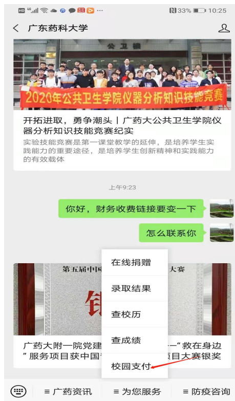
图 3.1-3 广东药科大学微信公众号统一支付平台登陆界面

(4) 学校官网登陆, 进入广东药科大学官网财务处网页, 点击左上角“综合服务平台”如图 3.1-4 所示