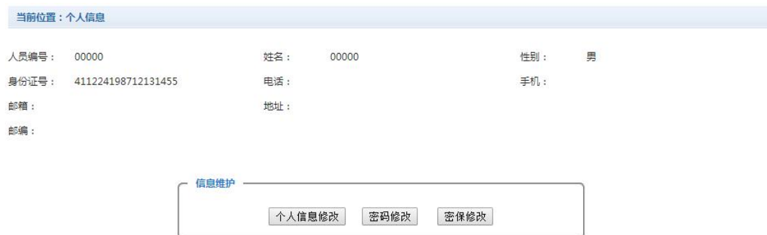
图 3.2-1 个人信息维护界面

登陆支付平台后，点击导航栏的个人信息按钮，显示个人信息确认及维护界面。如图 3.2-1 所示。 请确认个人信息无误后再进行缴费，避免误交费。