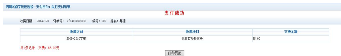
图 3.4-8 支付成功