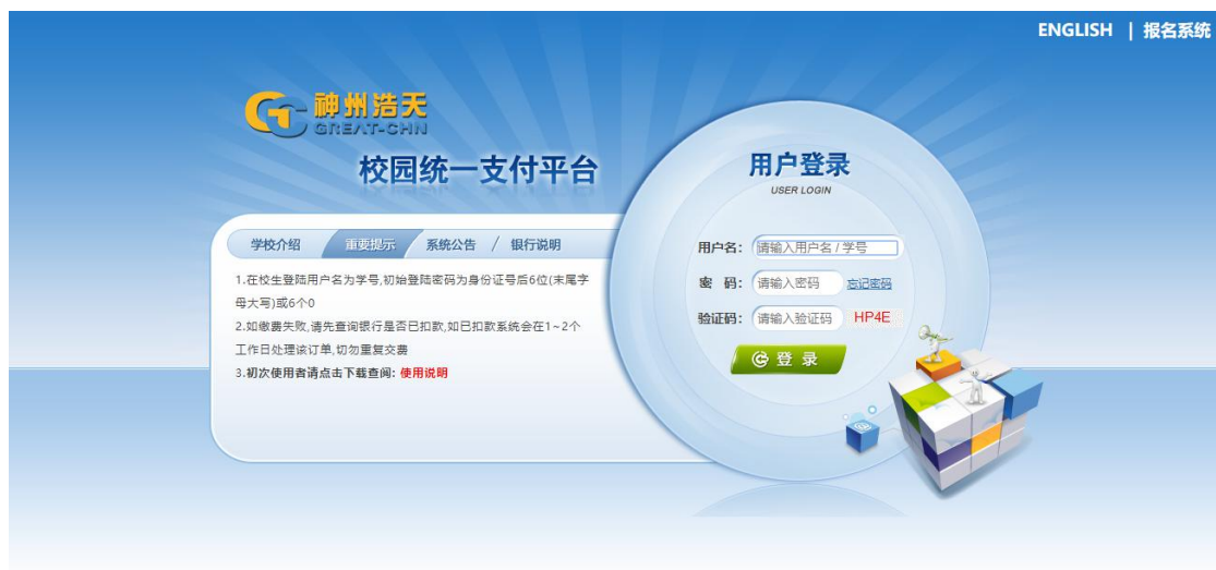
图 3.1-1 统一支付平台登陆界面

(2) 企业微信登陆，进入广东药科大学企业微信后，点击“校园统一支付平台”如图 3.1-2 所示