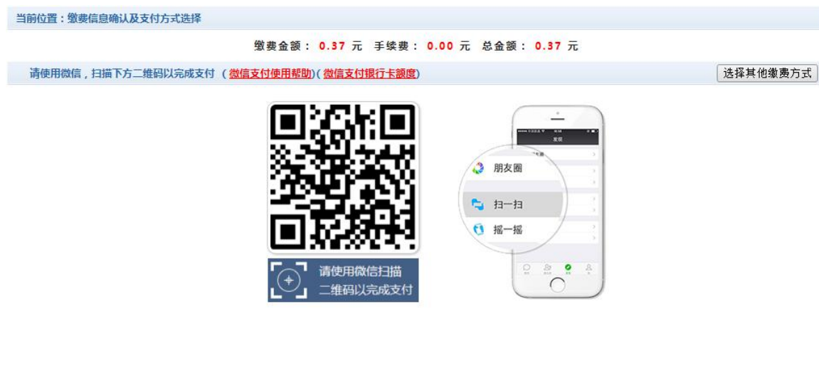
图 3.4-5 建行网上支付