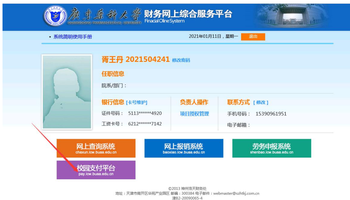
图 3.1-4 广东药科大学官网财务处网页统一支付平台登陆界面