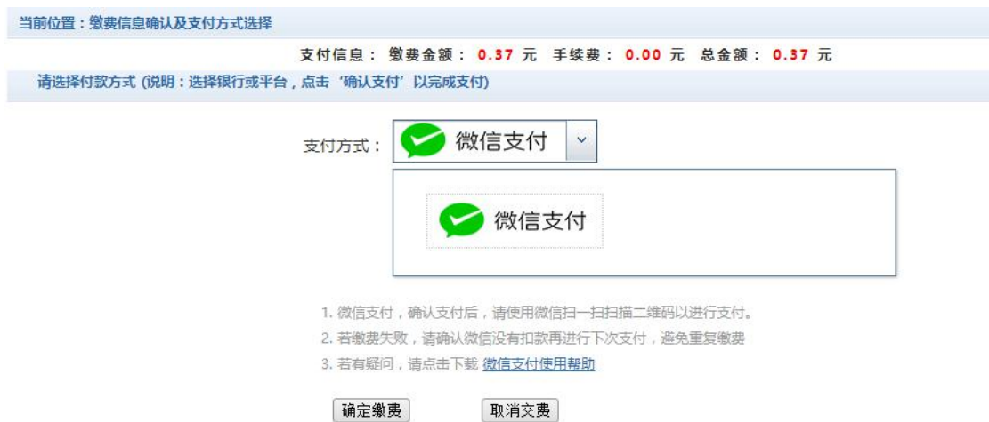
图 3.4-4 缴费方式选择